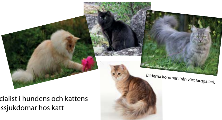
Bilderna kommer ifrån vårt färggalleri.